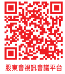
股東會視訊會議平台